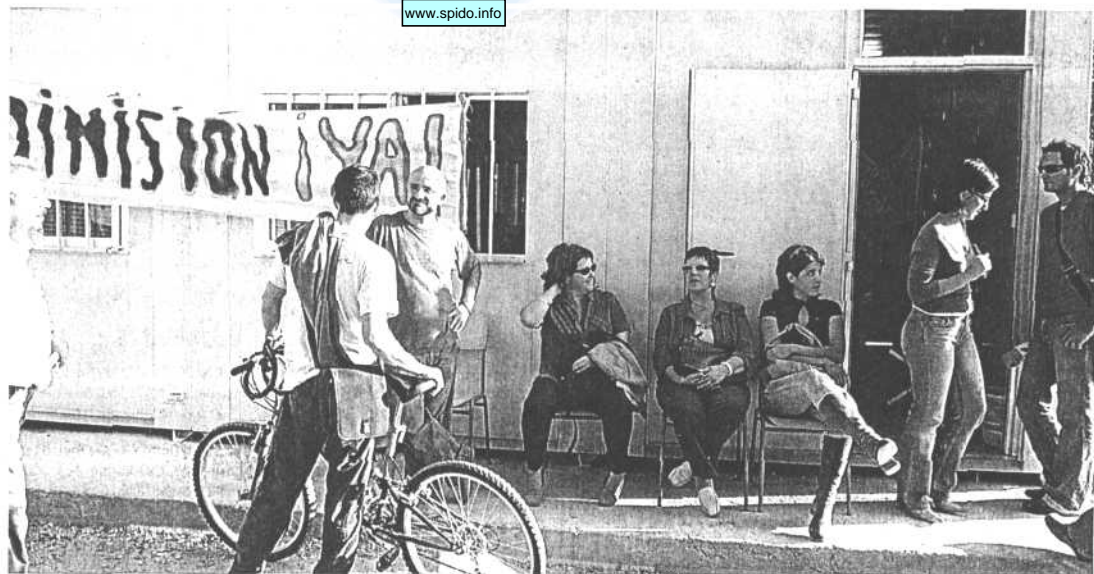
RECLUIDOS. Un grupo de profesores charla con alumnos y descansa en la puerta del aula prefabricada.