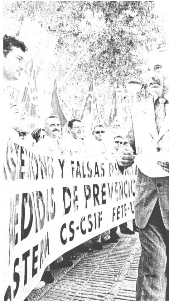
ENCUENTRO. El consejero, en la protesta.