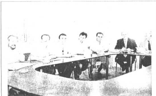
ENCUENTRO. Representantes de los sindicatos, ayer, reunidos con el secretario sectorial de Educación.

Unos 2.500 docentes, según los organizadores, y medio centenar, según la Policía Local, se concentraron allí para denunciar las amenazas, agresiones y denuncias falsas a las que están siendo sometidos los profesionales de la enseñanza. Los manifestantes se mostraron dispuestos a celebrar más actos de protesta. E incluso plantearon la posibilidad de convocar una jornada de huelga general en los centros educativos si no se atienden sus reclamaciones.