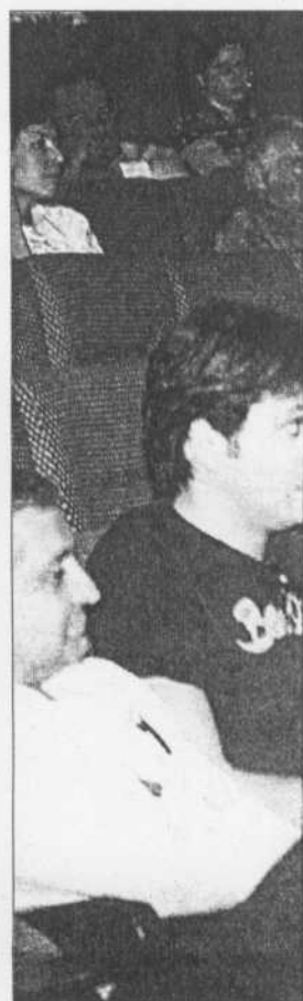
Entre el público que asistió el martes al debate