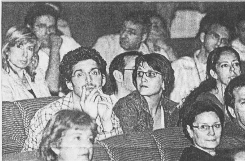
Muchos de los asistentes al debate eran estudiantes preocupados por su futuro laboral